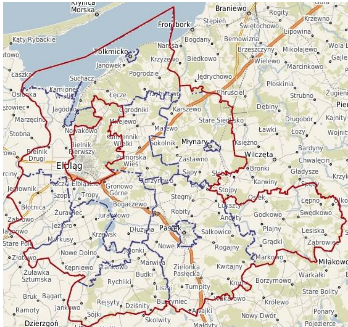
Rysunek 1. Mapa powiatu elbląskiego