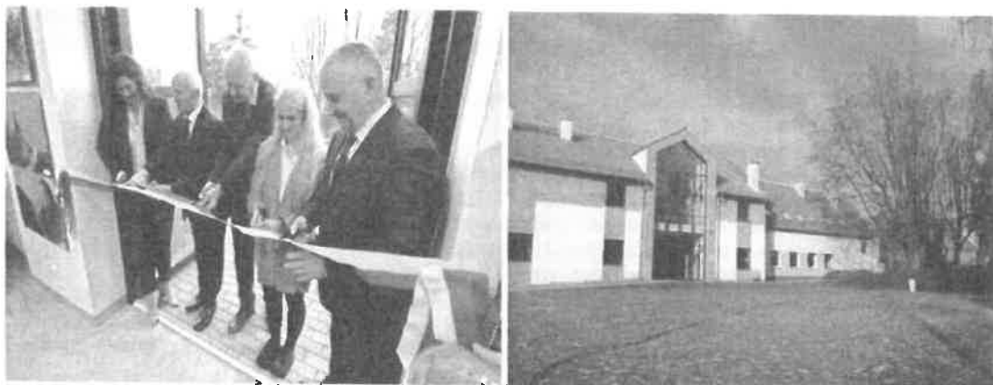
Zdjęcia z uroczystego otwarcia nowego budynku Liceum Sztuk Plastycznych w Gronowie Górnym.

Uroczyste otwarcie nowego budynku Liceum Sztuk Plastycznych w Gronowie Górnym miało miejsce w dniu 15 listopada 2019 r.