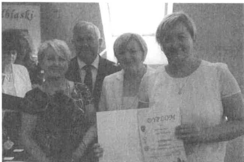
Zdjęcie z uroczystego wręczenia nagród i wyróżnień przyznanych w ramach konkursu Wies z inicjatywą .

Wręczenie nagród i wyróżnień odbyło się na sesji Rady Powiatu w Elblągu w dniu 28 czerwca 2019 r.