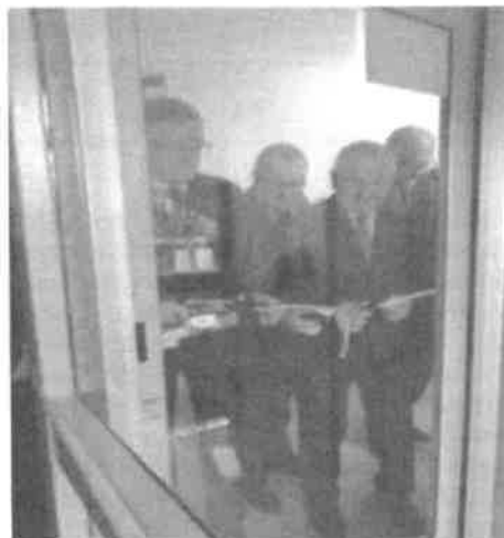
Zdjęcia z uroczystego przekazania do użytku windy w Poradni Psychologiczno-Pedagogicznej w Pasłęku

Stan bazy sportowo-rekreacyjnej placówek oświatowych można ocenić pozytywnie. Baza sportowa jest sukcesywnie modernizowana i doposażana. W październiku 2019 r. Powiat Elbląski podpisał porozumienia w sprawie organizacji udzielania świadczeń ogólnostomatologicznych we wszystkich szkołach, dla których jest organem prowadzącym oraz w Młodzieżowym Ośrodku Wychowawczym w Kamionku Wielkim. Podstawą prawną zawarcia powyższych porozumień był art. 12 ust.3 ustawy z dnia 12 kwietnia 2019r. o opiece zdrowotnej nad uczniami (Dz. U. z 2019 r. poz. 1078). Opiekę stomatologiczną w Liceum Sztuk Plastycznych w Gronowie Górnym, w Zespole Szkół Ekonomicznych i Technicznych oraz w Zespole Szkół w Pasłęku, sprawuje Niepubliczny Zakład Opieki Zdrowotnej EL Spółka z o.o. z siedzibą w Elblągu ul. Orzeszkowej 13, natomiast w Młodzieżowym Ośrodku Wychowawczym w Kamionku Wielkim - lekarz stomatolog posiadający gabinet w Milejewie (opieka stomatologiczna sprawowana jest w ramach indywidualnej praktyki lekarskiej).