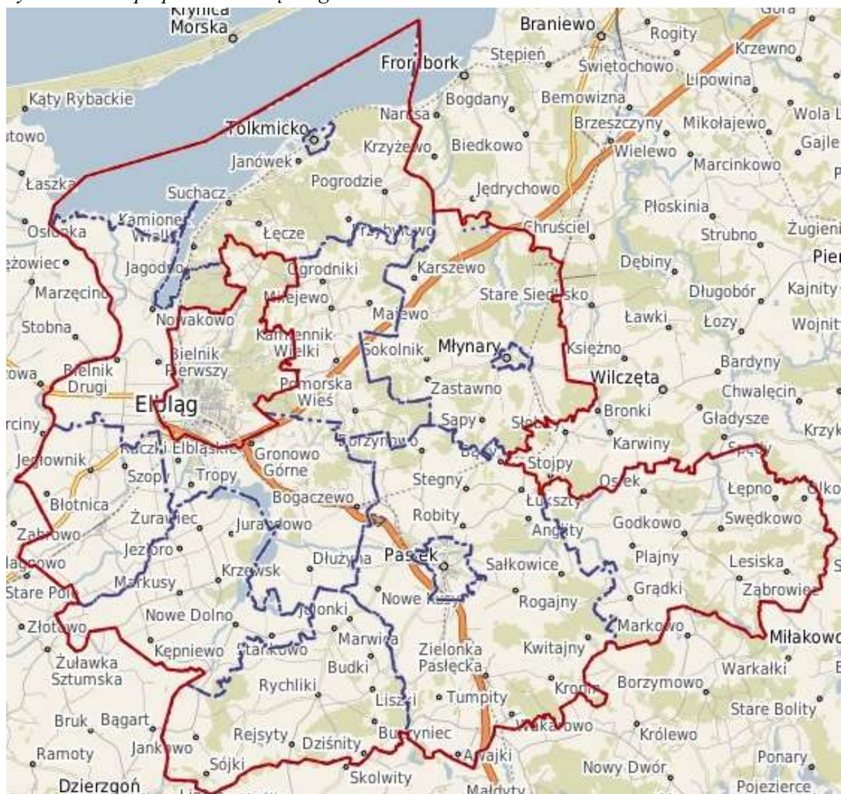
Rysunek 1. Mapa powiatu elbląskiego