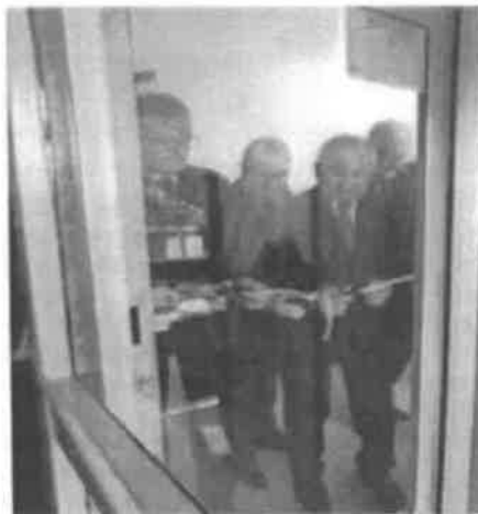
Zdjęcia z uroczystego przekazania do użytku windy w Poradni Psychologiczno-Pedagogicznej w Pasłęku

Stan bazy sportowo-rekreacyjnej placówek oświatowych można ocenić pozytywnie. Baza sportowa jest sukcesywnie modernizowana i doposażana. W październiku 2019 r. Powiat Elbląski podpisał porozumienia w sprawie organizacji udzielania świadczeń ogólnostomatologicznych we wszystkich szkołach, dla których jest organem prowadzącym oraz w Młodzieżowym Ośrodku Wychowawczym w Kamionku Wielkim. Podstawą prawną zawarcia powyższych porozumień był art. 12 ust.3 ustawy z dnia 12 kwietnia 2019r. o opiece zdrowotnej nad uczniami (Dz. U. z 2019 r. poz. 1078). Opiekę stomatologiczną w Liceum Sztuk Plastycznych w Gronowie Górnym, w Zespole Szkół Ekonomicznych i Technicznych oraz w Zespole Szkół w Pasłęku, sprawuje Niepubliczny Zakład Opieki Zdrowotnej EL Spółka z o.o. z siedzibą w Elblągu ul. Orzeszkowej 13, natomiast w Młodzieżowym Ośrodku Wychowawczym w Kamionku Wielkim - lekarz stomatolog posiadający gabinet w Mlejewie (opieka stomatologiczna sprawowana jest w ramach indywidualnej praktyki lekarskiej).