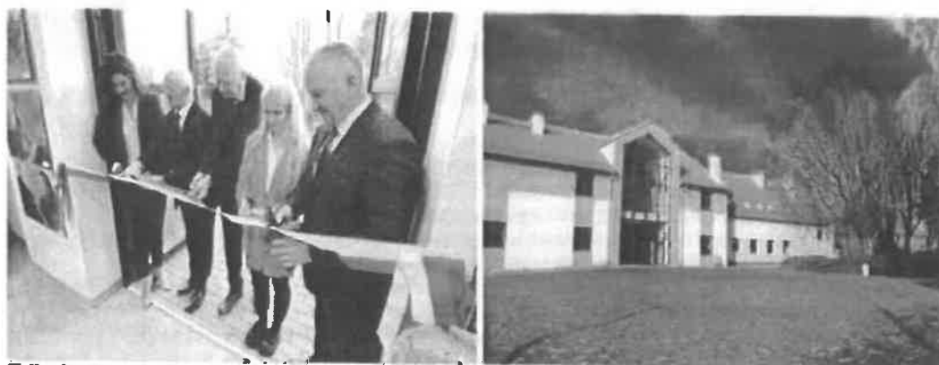
Zdjęcia z uroczystego otwarcia nowego budynku Liceum Sztuk Plastycznych w Gronowie Górnym.

Uroczyste otwarcie nowego budynku Liceum Sztuk Plastycznych w Gronowie Górnym miało miejsce w dniu 15 listopada 2019 r.