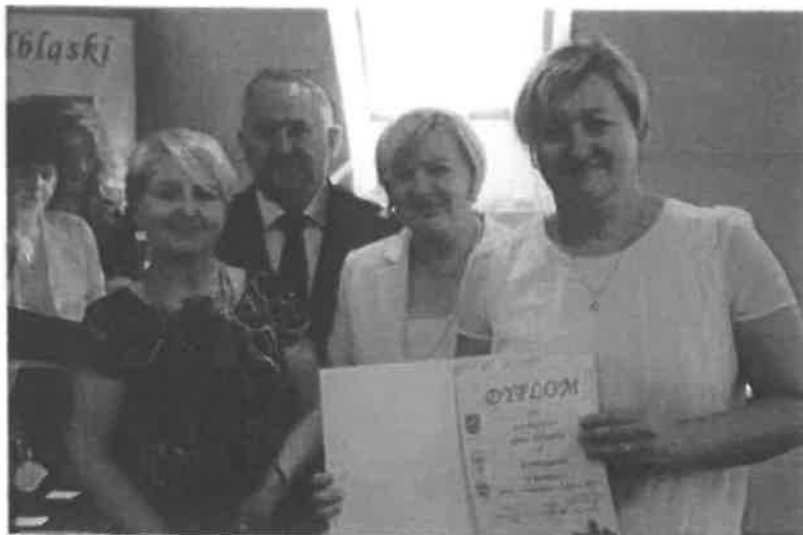
Zdjęcie z uroczystego wręczenia nagród i wyróżnień przyznanych w ramach konkursu Wież z inicjatywą .

Wręczenie nagród i wyróżnień odbyło się na sesji Rady Powiatu w Elblągu w dniu 28 czerwca 2019 r.