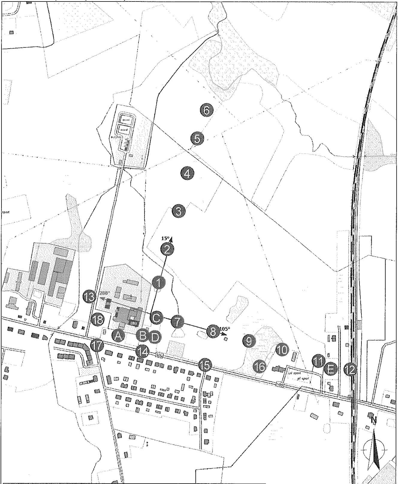
Zař. 2. Widok pionów pomiarowych